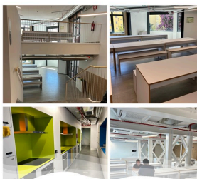
Residência Universitária Manuel da Maia - Lisboa