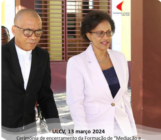
ULCV, 13 março 2024 Cerimónia de encerramento da Formação de “Mediação e Arbitragem de Cabo Verde”, presidida pela Sua Excelência a Senhora Ministra da Justiça