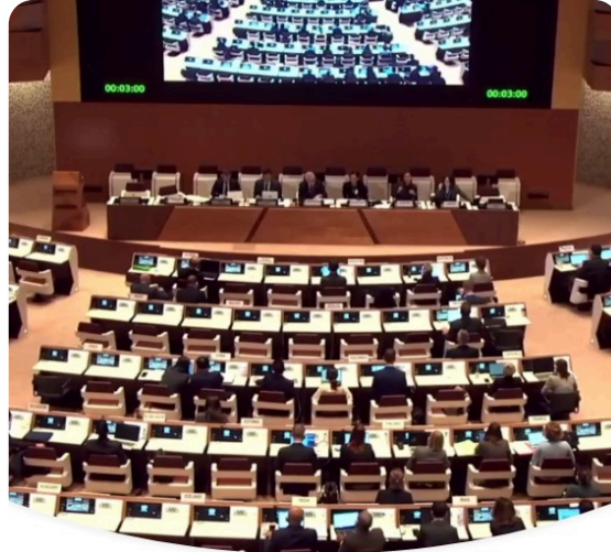
Estudantes da Lusófona participam de reunião da ONU em Genebra Marco 2024